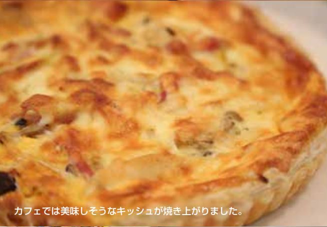
カフェでは美味しそうなキッシュが焼き上がりました。